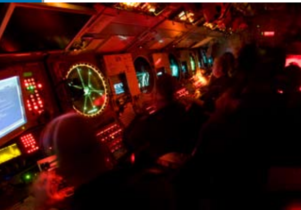
Radar werkt alleen als je op periscoopdiepte vaart. Onder water 'kijk' je met sonar.

Om onder water te duiken moet een onderzeeboot zwaarder worden. Hoe je dat doet? Door de tanks vol te laten lopen met water. Om weer aan de oppervlakte te komen, wordt onder hoge druk lucht in en water uit de tanks geperst. De maximale duikdiepte van de Nederlandse onderzeeërs? Zeker enkele honderden meters. Hoe diep precies, wil de marine niet prijsgeven. Zelfs aan boord weet alleen de commandant hoe diep zijn schip veilig kan duiken. Komt het schip onder deze grens, dan wordt de romp samengedrukt en implodeert het schip. Van de Russische onderzeeboot Komsomolets is bekend dat zijn diepterecord op 1000 meter lag. De onderzoeksboot Trieste van Jacques Piccard bereikte in 1960 een recorddiepte van 10.916 meter op de bodem van de Marianentrog. Dit 2500 kilometer lange zeebodemdalen bevindt zich in de buurt van de Filipijnen en is het diepste punt van de aarde.