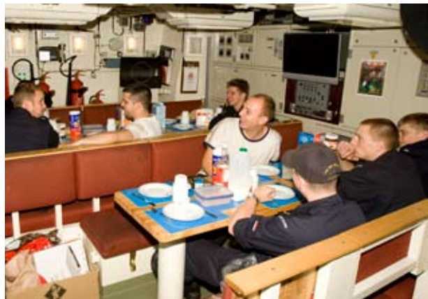
Eten is een dagelijks hoogtepunt als je verder alleen kunt werken, studeren en slapen. Met beschuit en hagelslag.