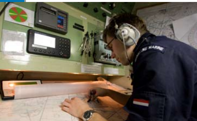
Gps werkt niet onder water. Een kompas wel. Dus zet je je koers met een gradenboog uit op een kaart.