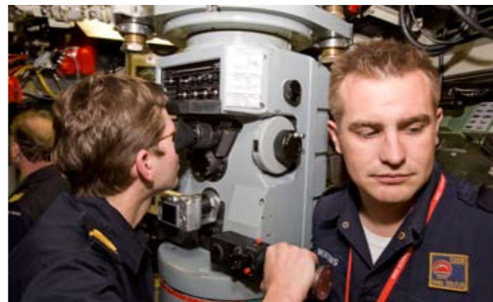
Periscopdiepte? Dan doe je een gps-meting om je positie te checken.