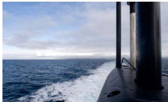
Boven water vaart de onderzeeboot op een dieselmotor. Onder water schakelt hij over op elektrische voortstuwing.