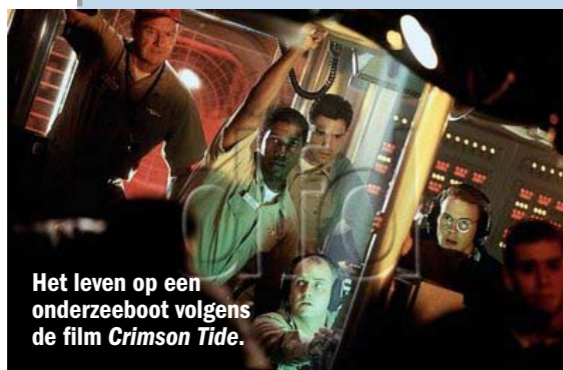
Het leven op een onderzeeboot volgens de film Crimson Tide .

sfeerbeelden. Maar voor het verhaal geen aanraders. De mannen van de onderzeedienst herkennen zich in geen van deze films. Volgens hen komt er maar één in de buurt van het échte onderzeeleven. Daarin zijn de diensten lang en is het leven zwaar. Eten is elke dag een hoogtepunt. En de mannen zijn op elkaar aangewezen. Van de kijker wordt hetzelfde doorzettingsvermogen gevraagd. Want de director's cut van Das Boot is 3,5 uur aan filmische hoogte-, maar zeker ook dieptepunten.