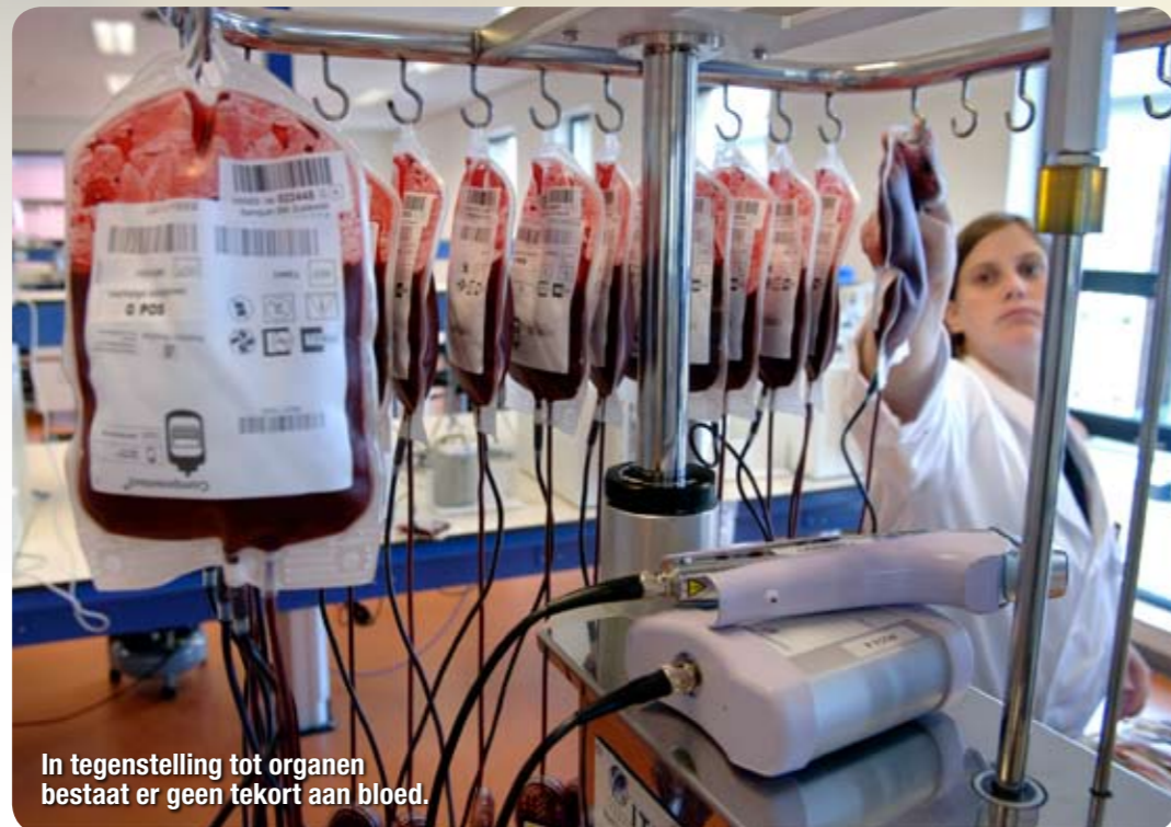
In tegenstelling tot organen bestaat er geen tekort aan bloed.

register te mijden als de pest. Wie het formulier er toch bij pakt, loopt meteen tegen een tweede psychologisch obstakel aan: het sociaal dilemma. Want