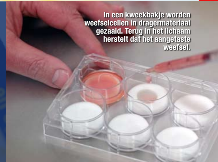
In een kweekbakje worden weefselcellen in dragermateriaal gezaaid. Terug in het lichaam herstelt dat het aangetaste weefsel.

Nederlandse universiteiten zijn bezig met kweken van weefsel buiten het menselijk lichaam. Op een andere methode wordt gestudeerd: de groei van bot, kraakbeen of bloedvaten in het eigen lichaam. Als dat lukt, behoort bijvoorbeeld botontkalking snel tot het verleden.